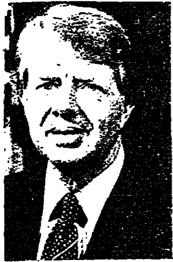
ان الرئيس كارتر يفكر مؤخرا احتمال ممارسة شظف عسكرية على ايران ، اذا لم تكف الوسائل الاقتصادية والديبلوماسية

وفي غضون ذلك تمضي أوروبا القوية في مناصرة الولايات المتحدة اقتصادياً ، وتوجه النقد الذي يصف سياسة الولايات المتحدة . وقد يكون هذا كله مشروعا ، ولكن السؤال الذي اخذ الاميركان بطرحه ، وبالحاح هو : هل ان في الامكان الاستثمار على هذا الحال ؟ وفي الاسابيع الاخيرة ، وبعد ان بدأت الولايات المتحدة حملة واسعة التغطيات لايضاح موقفها من ازمته ايران وافغانستان فقد اخذت دول أوروبا واليابان تظهر تهما . ويبدو ان الاروبيين قد تفكروا بانهم اذا جروا الخيل اكثر مما يجب ، فقد يؤدي ذلك الى خلاف خطير جدا مع الولايات المتحدة . ولا ينسى احد ازعاجه الاتحاد السوفياتي لا يشهرون زعماء الولايات المتحدة ، وانه اذا ضعفت أوروبا بشكل كبير من ناحية عسكرية نتجبة الدول الرابطة ، واذا ظهرت علامات اسفهام بالنسبة لحسن نية الولايات المتحدة - فان السوفيات سوف لا يكونون الفرصة . وليس ثمة من ينسى انه في الازمة التي شنتها عام ١٩٦٨ ، وفي الازمة الهنغارية فيها عام ١٩٥٦ ، فان السوفيات لم